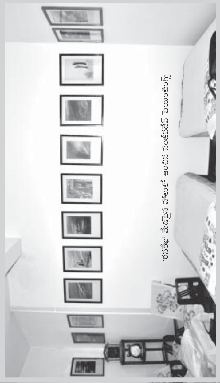
‘రసరేఖ’ మేడపైన హోలులో ఉంచిన సంజీవదేవ్ పెయింటింగ్.