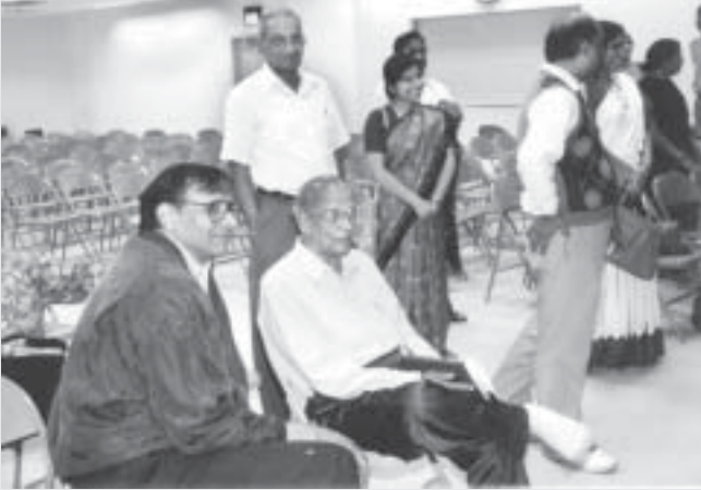
అమెరికా పర్యటనలో సంజీవదేవ్