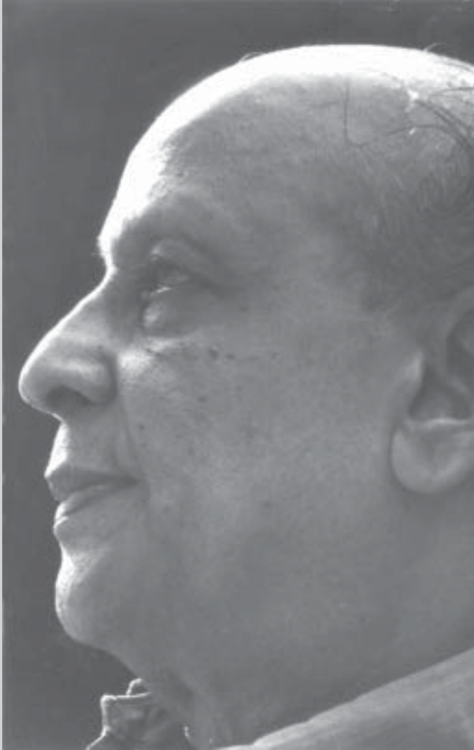
తదేక చింతసలో డాక్టర్ దేవ్