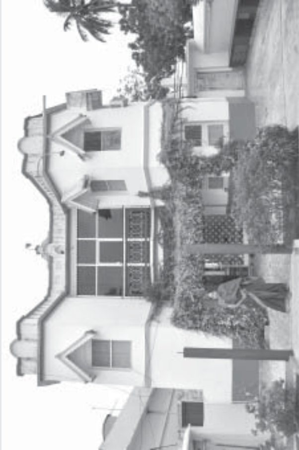
సంజీవదేవ్ నివాస సౌధం : 'రసరేఖ' - తుమ్మపూడి