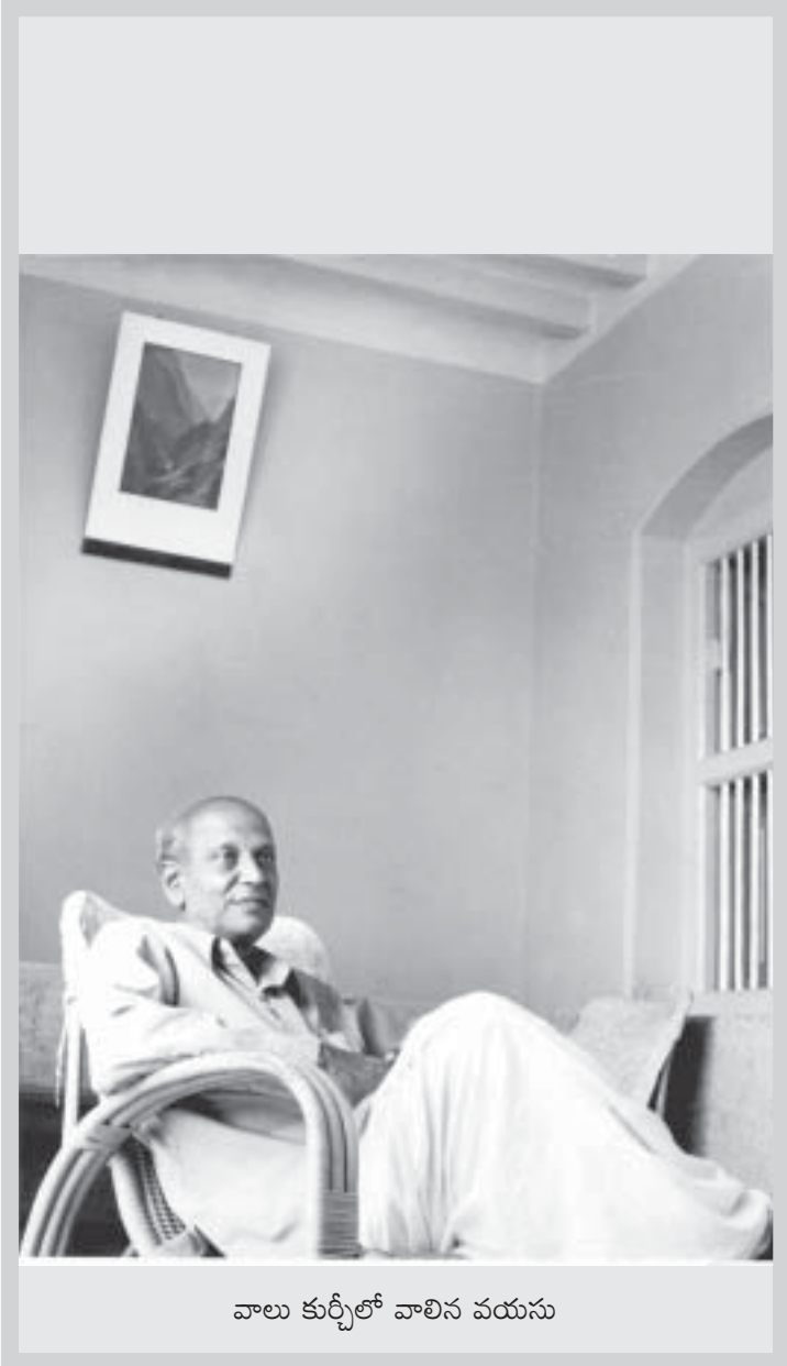
వాలు కుర్చీలో వాలిన వయసు