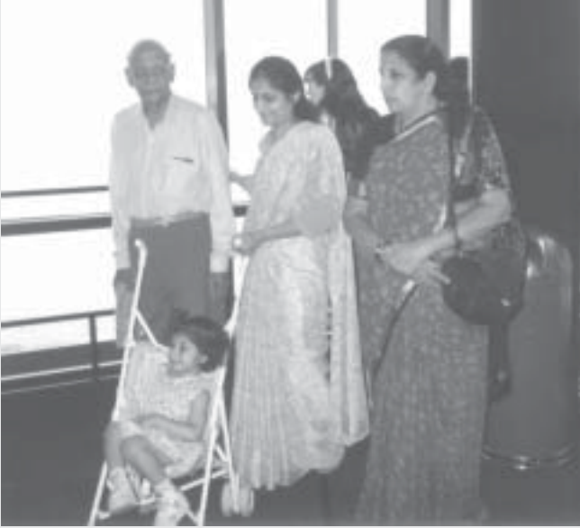
చిన్న కోడలు సాహితీతో దేవ్ దంపతులు