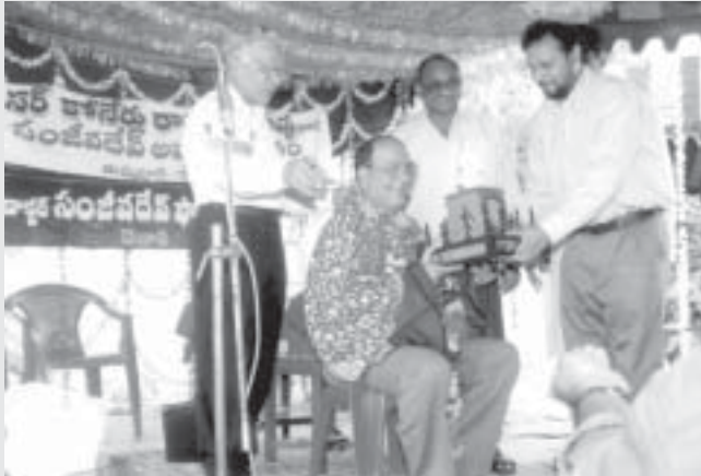
సంజీవదేవ్ ఫౌండేషన్ సుండి పురస్కారం అందుకుంటున్న ప్రొఫెసర్ కోనేరు రామకృష్ణారావు